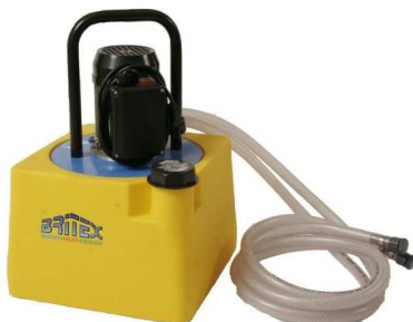
PC200 - FLOW Basic. zbiornik 20l.