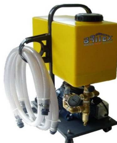
PC206 - FLOW Maxima 20/40. zbiornik 20l.