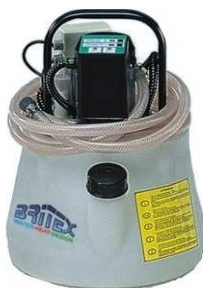
PC102 - PRO 24/90RA. zbiornik 24l.