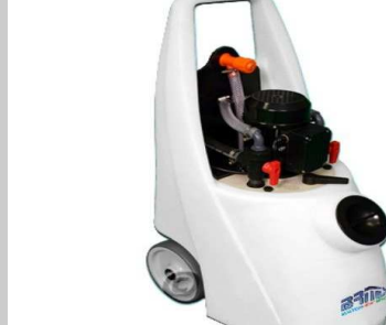
PC207 - PRO 40/150 Quantum, zbiornik 40l.