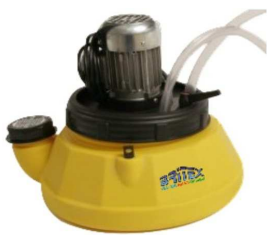
PC202 - FLOW Round. zbiornik 5l.