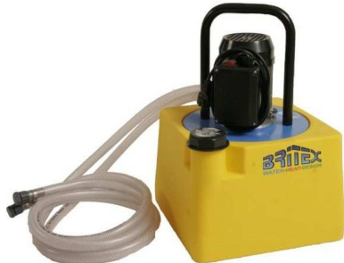
PC203 - FLOW 20/56R. zbiornik 20l.