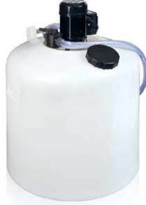
PC106 - PRO 200/150R, zbiornik 200l.