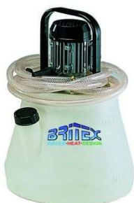
PC101 - PRO 24/90R. zbiornik 24l.