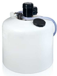
PC105 - PRO 100/150R, zbiornik 100l.