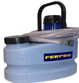
PC402 - EURO 20/90R. zbiornik 20l.