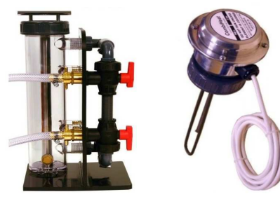
PC300-Zestaw MAG PC301-Grzałka GZ3